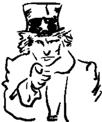
Menos mal que en política internacional seguimos siendo garantes de la libertad